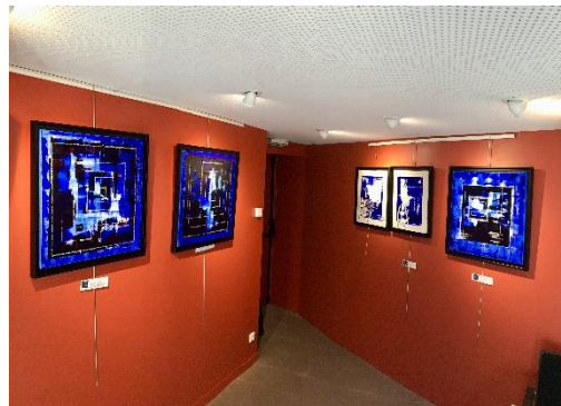
Espace au sous-sol (murs couleur ocre)