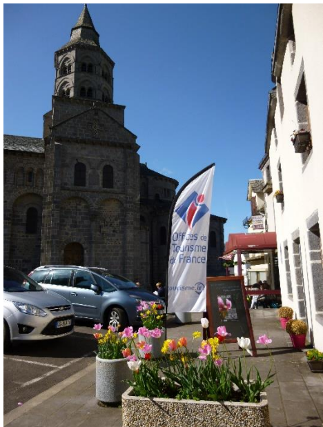
Façade extérieur côté Basilique

Le Bureau d'Accueil Touristique d'Orcival :