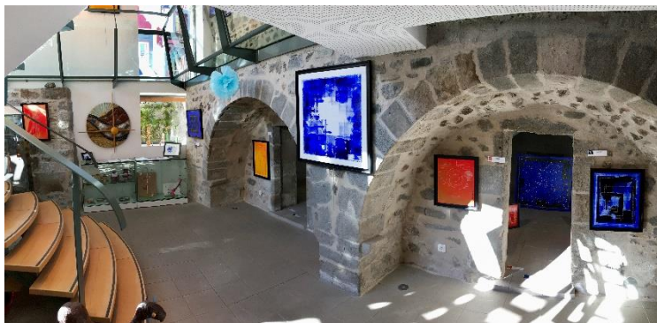
Espace au sous-sol (caves voûtées et artisanat)