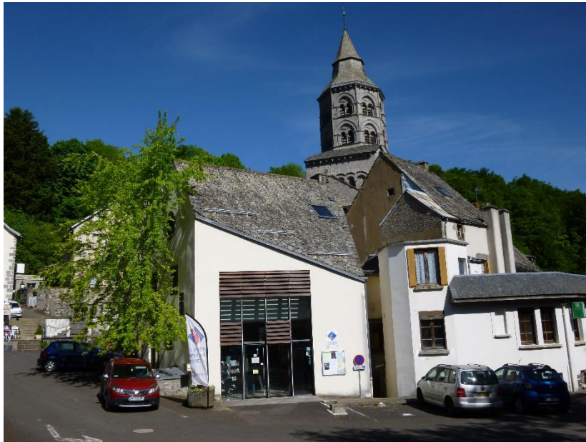
Façade extérieur côté rue