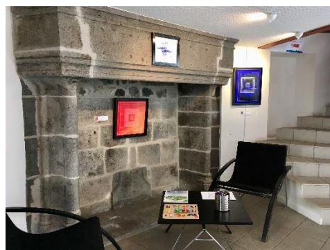
Espace à l'étage (cheminée)