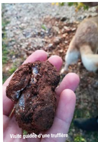
Visite guidée d'une truffière